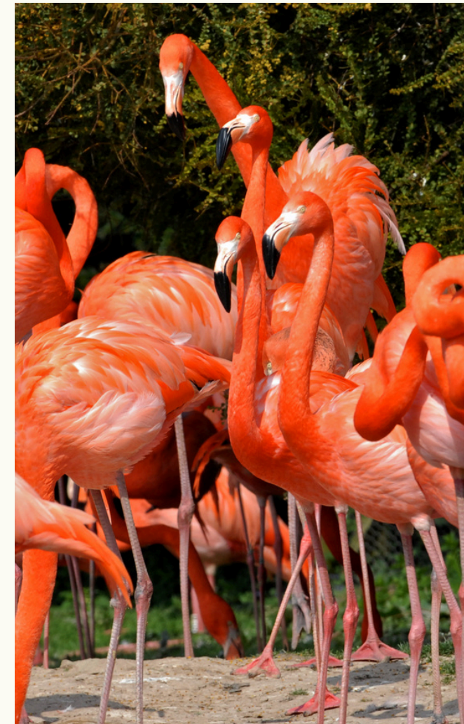
Naturaleza: Reservas naturales y biodiversidad