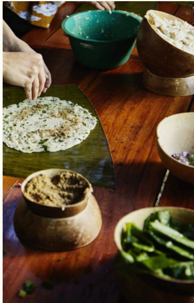
Experiencia gastronómica: Taller culinario