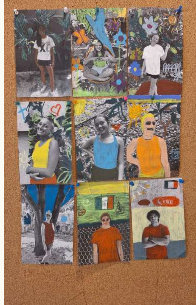
Inmersión cultural y lingüística