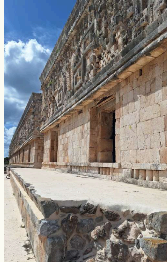
Historia y Arqueología