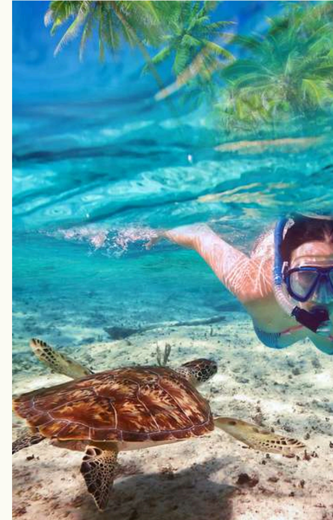
Conservación y biodiversidad