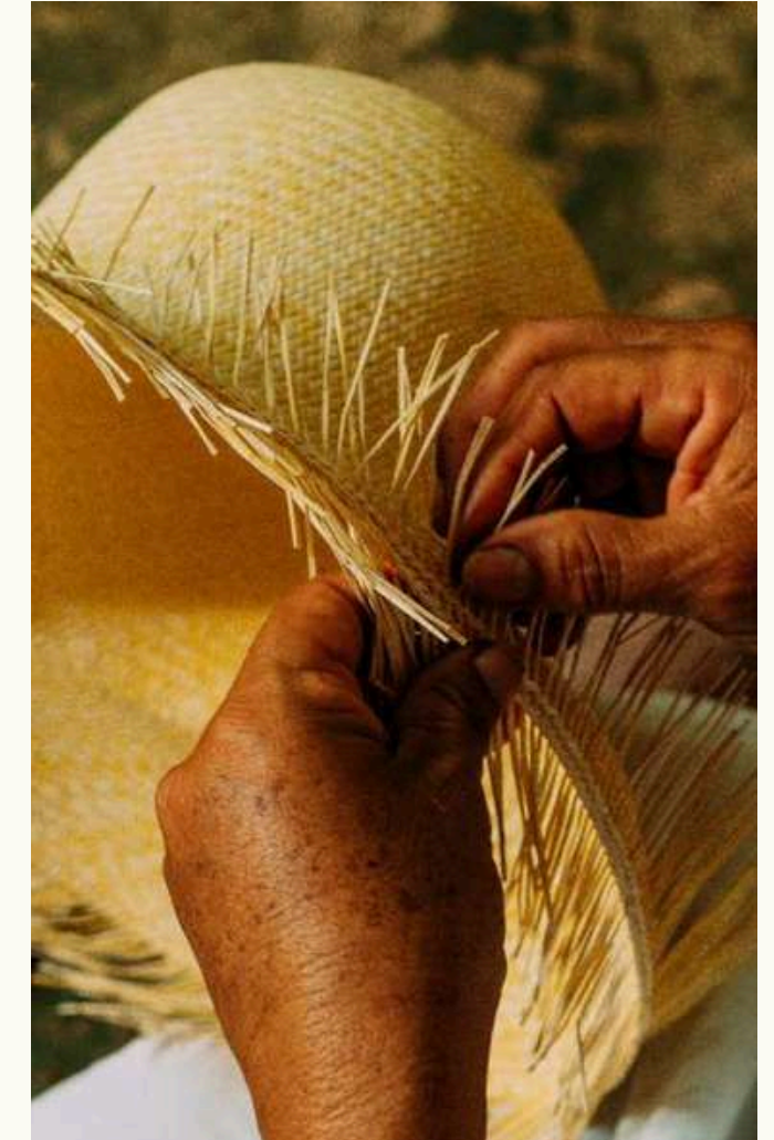
Tradiciones vivas y patrimonio cultural