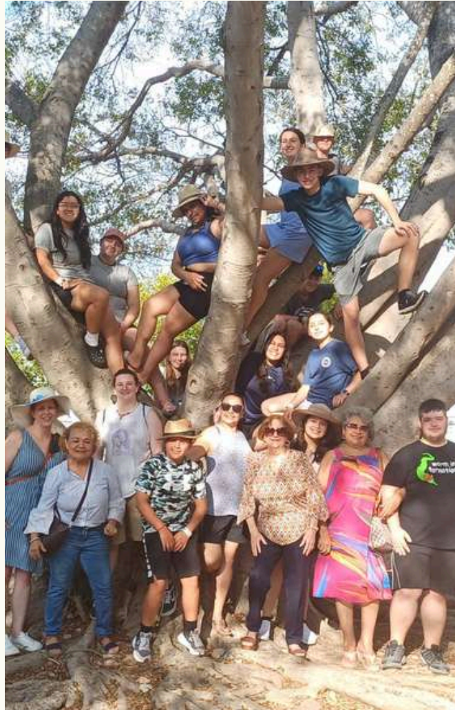
Homestay con familias locales